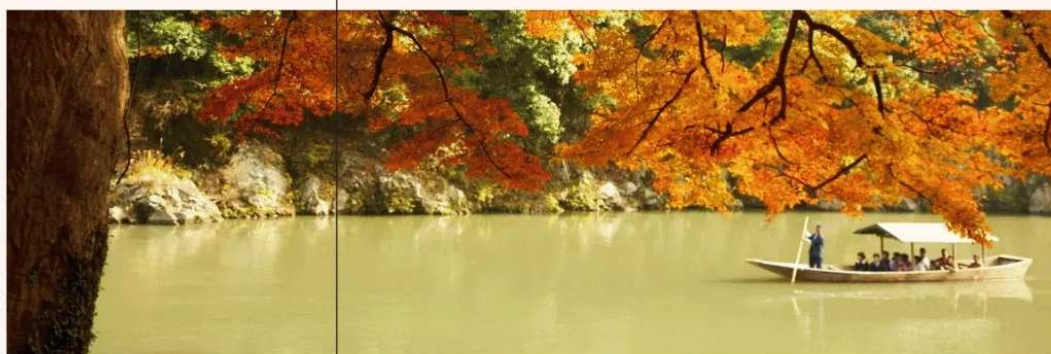
隱於古都的貴族桃源