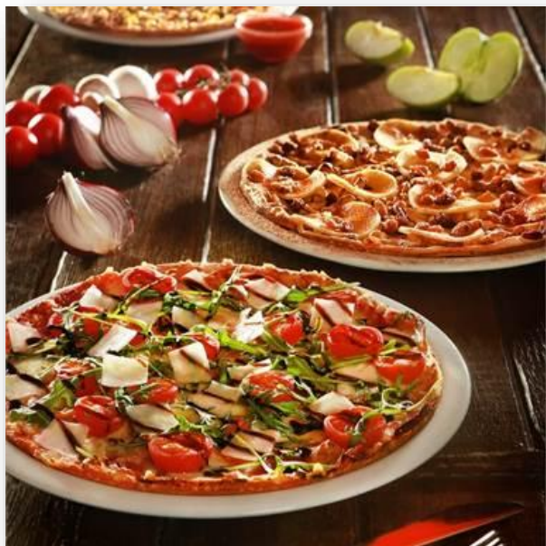
荷蘭鄉村煎餅風味