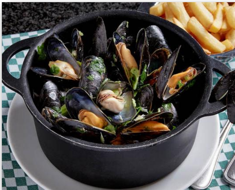
經典比利時啤酒淡菜