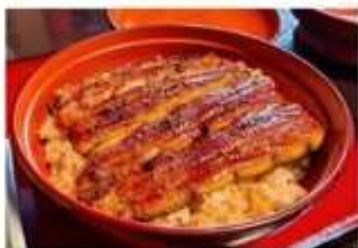
百年老店菊水樓~鰻魚飯