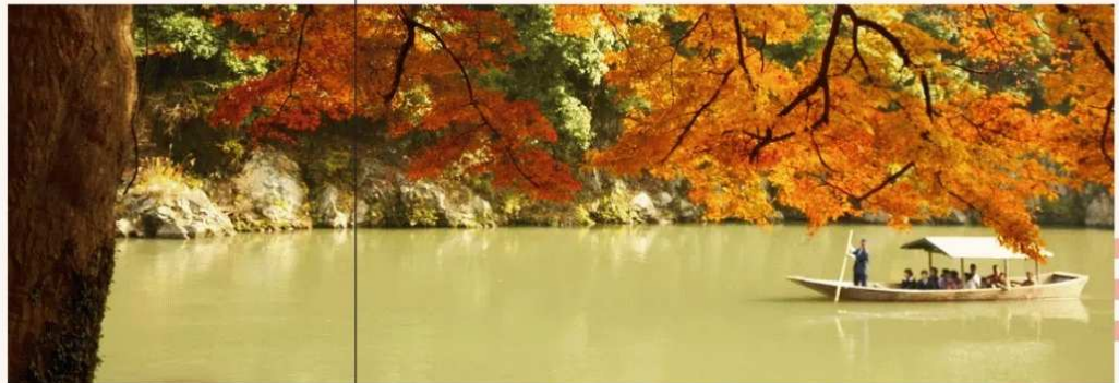
隱於古都的貴族桃源