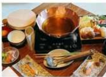
京都虹夕諾雅 飯店內早餐