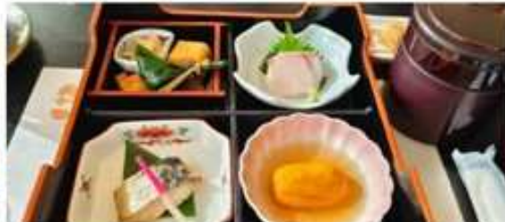
嵐山豆腐風味特色料理