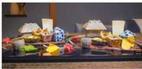
京都虹夕諾雅 飯店內晚餐