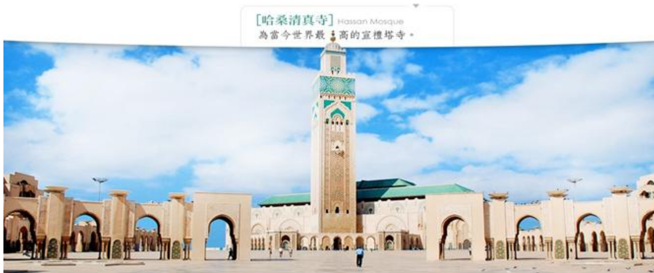
【哈桑清真寺】 Hassan Mosque 為當今世界最高的宣禮塔寺。